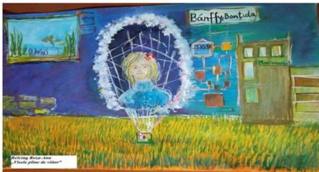
Desen „Visele pline de viitor” de Belciug Roza-Ana,eleva cl. a VIII-a,gimn.,V.Ceban”